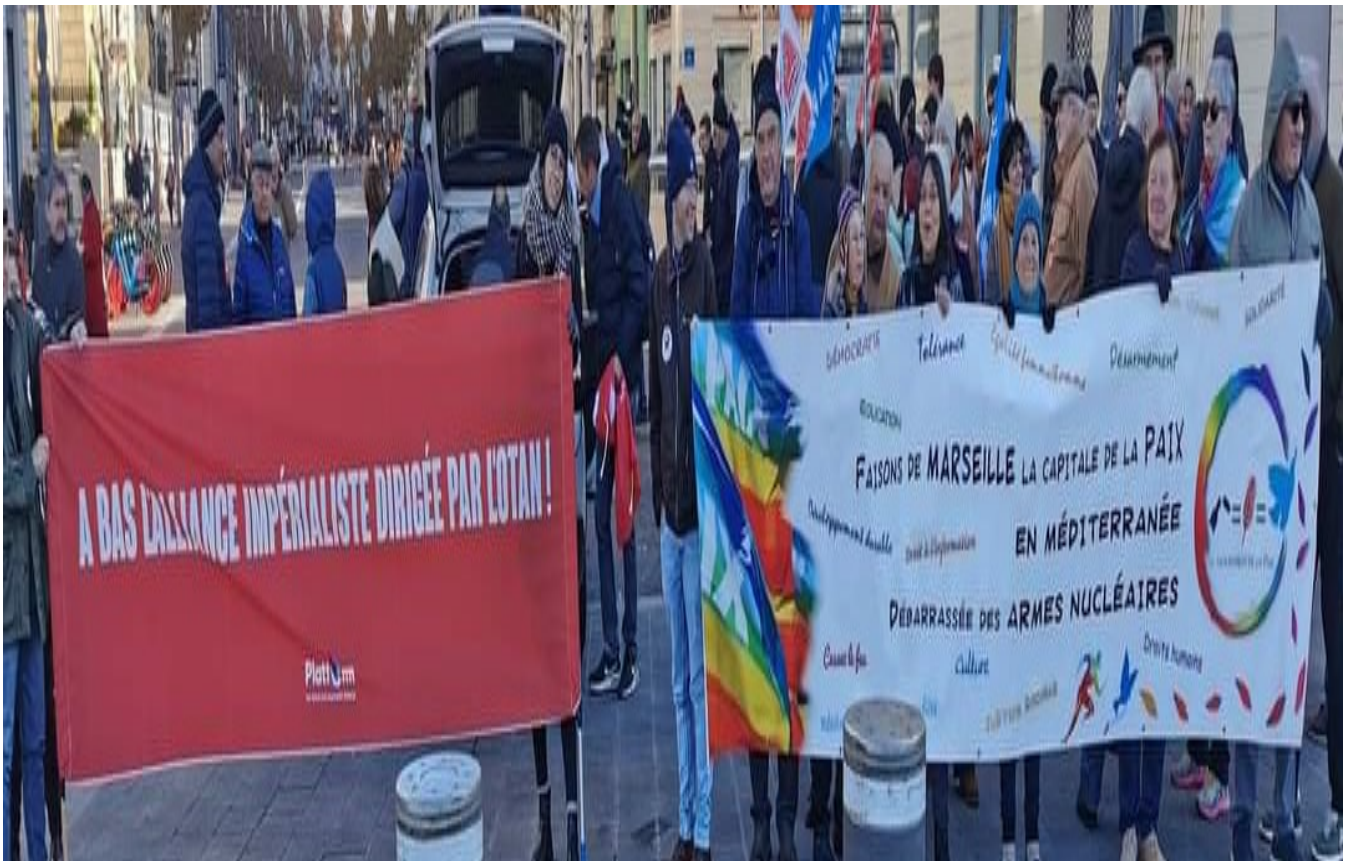
Rassemblement pour la paix, décembre 2022