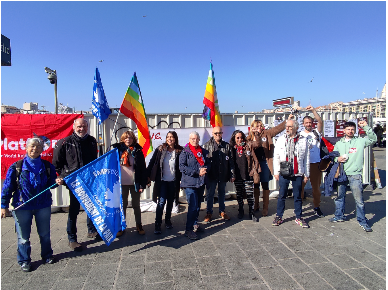
Rassemblement pour la paix, mars 2023