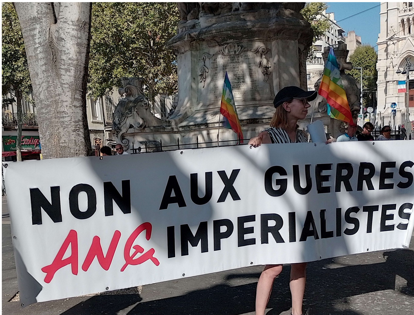
Rassemblement pour la paix, été 2022