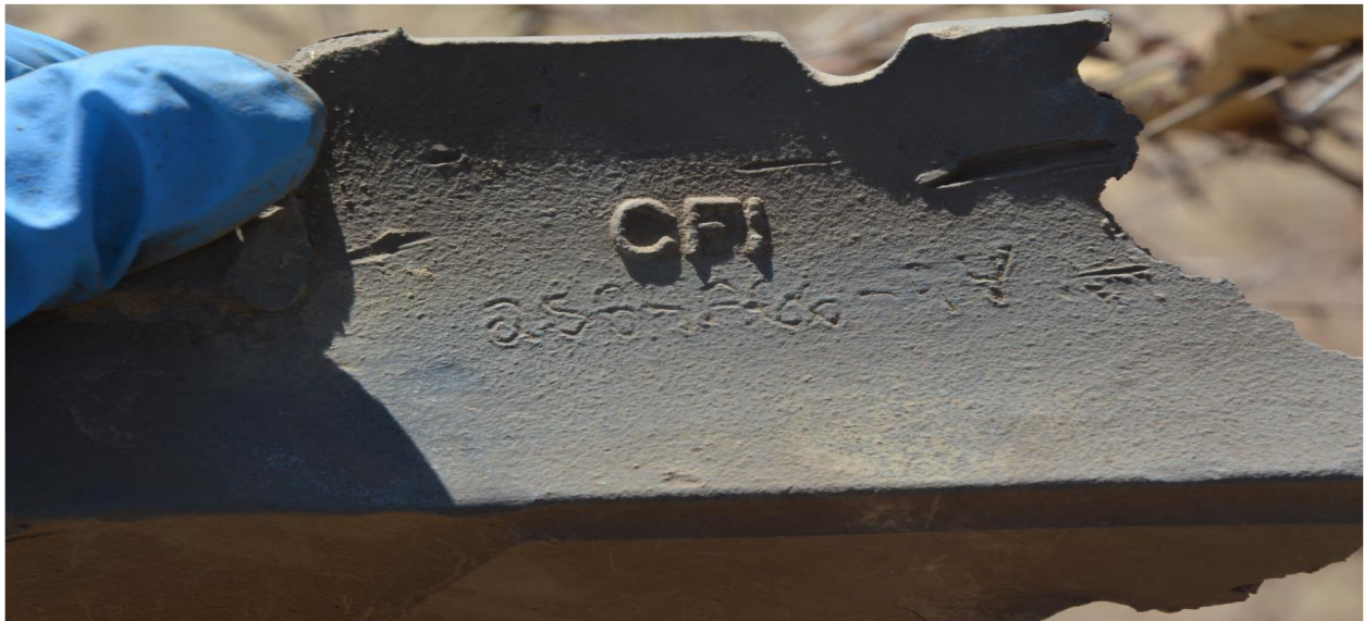
Photo 11 : Vue rapprochée de l'inscription gravée, portée au verso de l'une des deux pièces métalliques. (Inscription "CFI" et une série de chiffres peu lisibles).