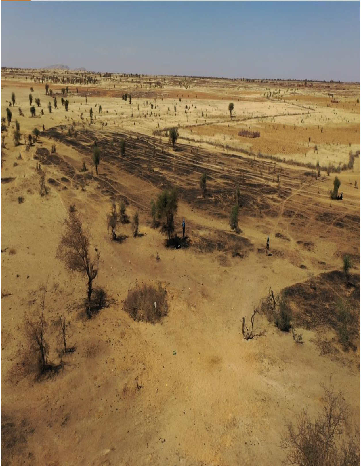
Photo 3 : Vue générale aérienne de la zone en direction du Nord-Ouest, où s'étend une vaste zone calcinée