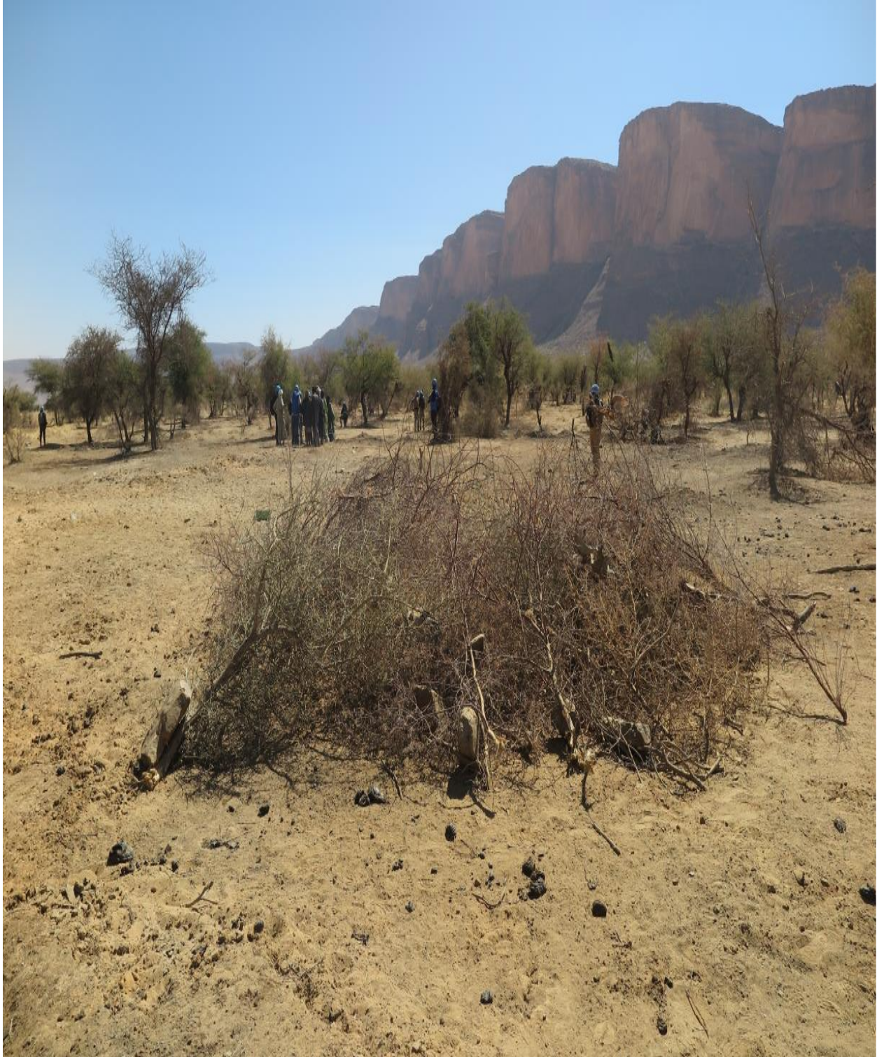
Photo 6 : Vue de la zone centrale d'investigation, en direction de l'Est.