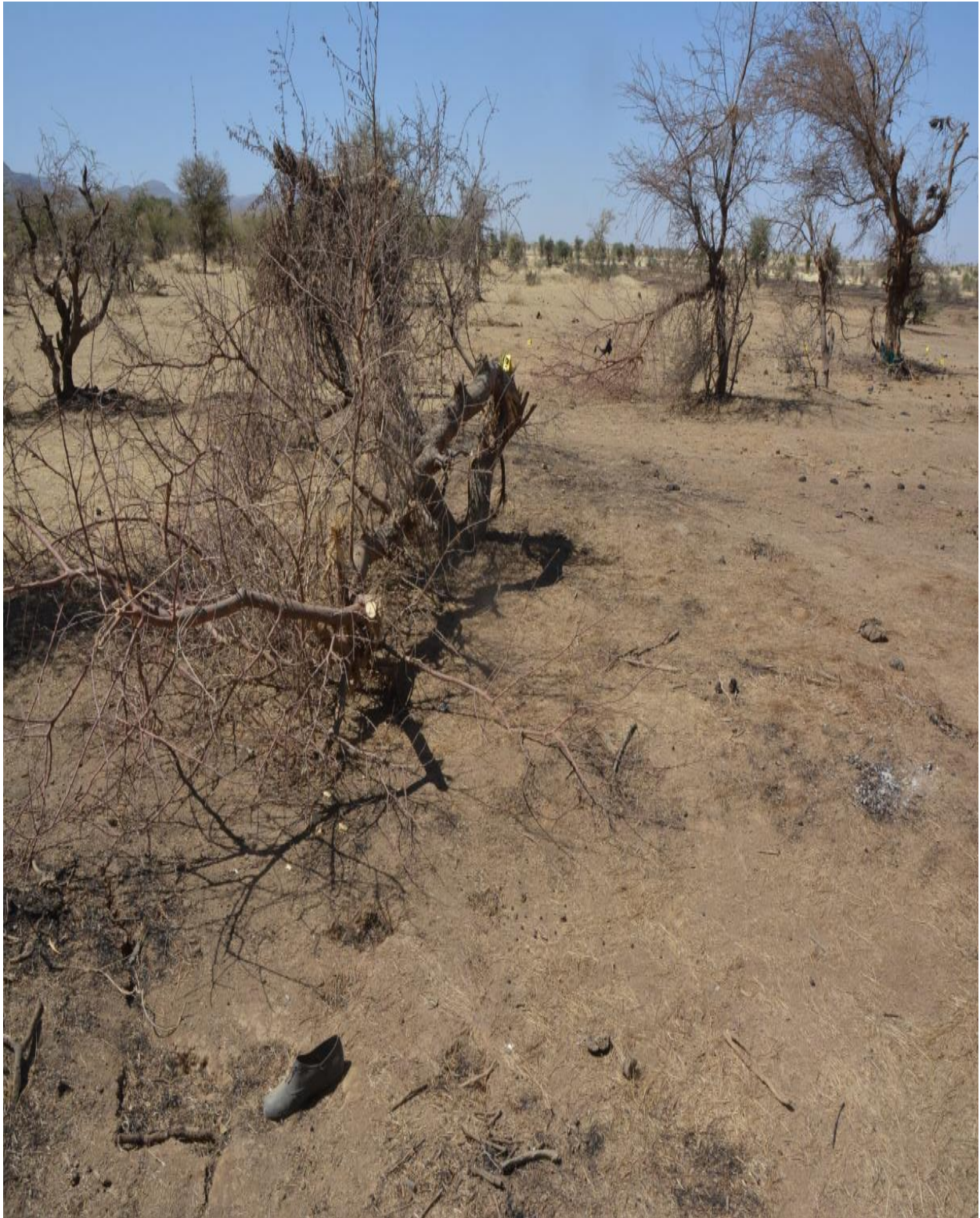
Photo 5 : Vue générale d'une zone montrant un arbre partiellement arraché