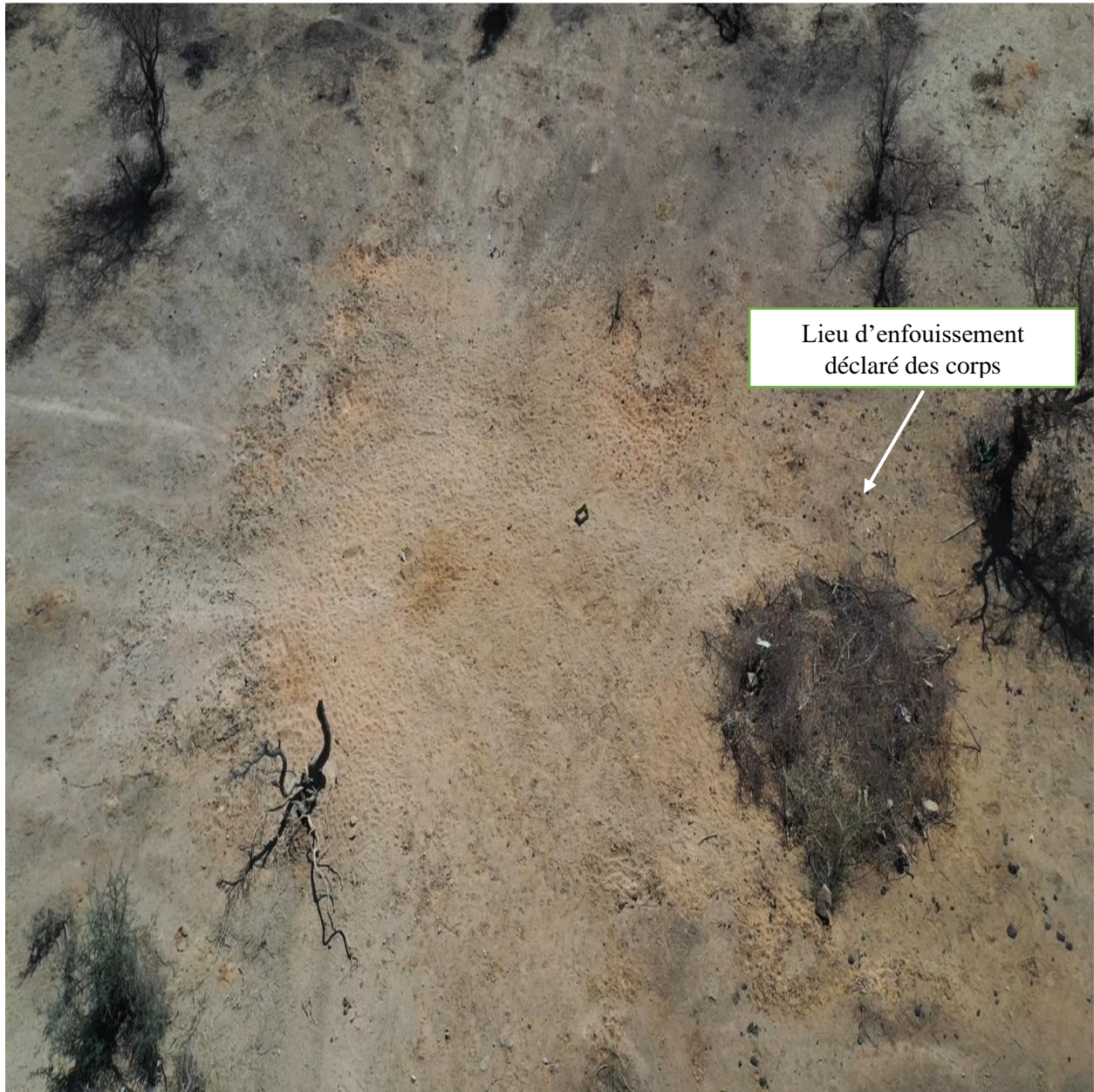
Photo 7 : Vue générale de la zone centrale d'investigation (zone meuble comprenant le lieu d'enfouissement présumé des potentielles victimes, d'après les déclarations des villageois de Bounty).