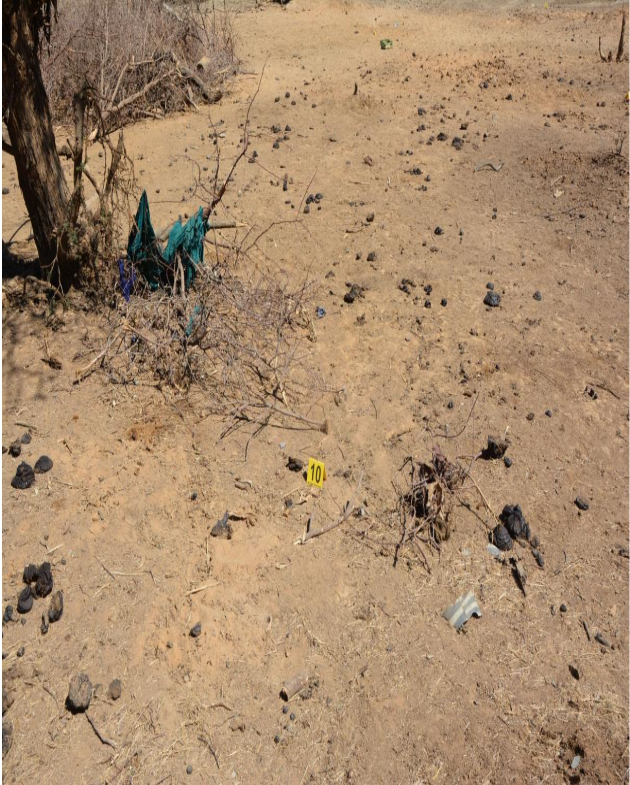
Photo 12 : Vue d'une zone comprenant notamment plusieurs artéfacts de tissus, de couleur bleus, verts et beiges-marrons, pris ou posés dans les branchages, à proximité du lieu d'enfouissement. Présence d'une pelle et d'une bêche.