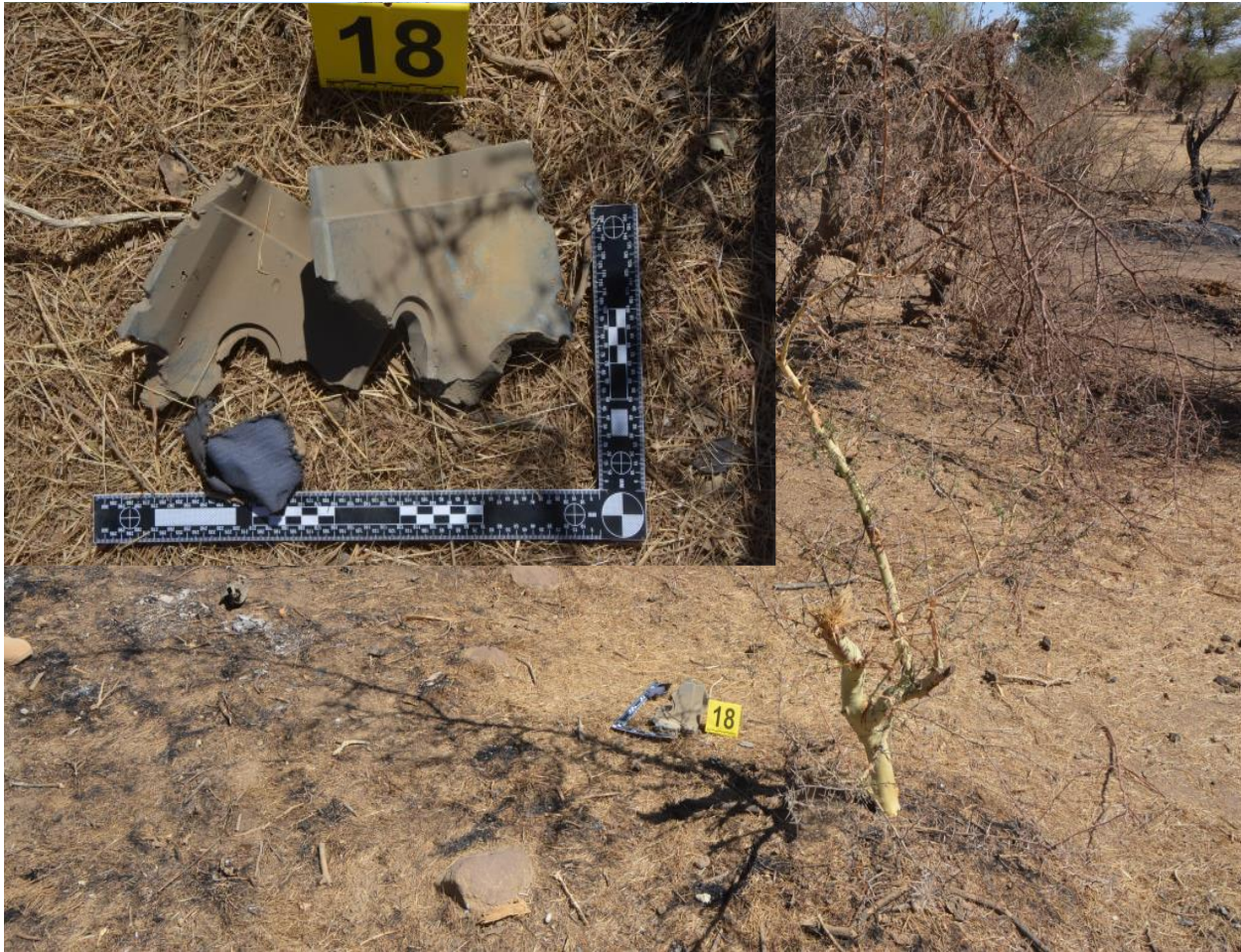
Photo 10 : Vue générale de 2 morceaux de métal de même nature et d'un fragment de tissu bleu