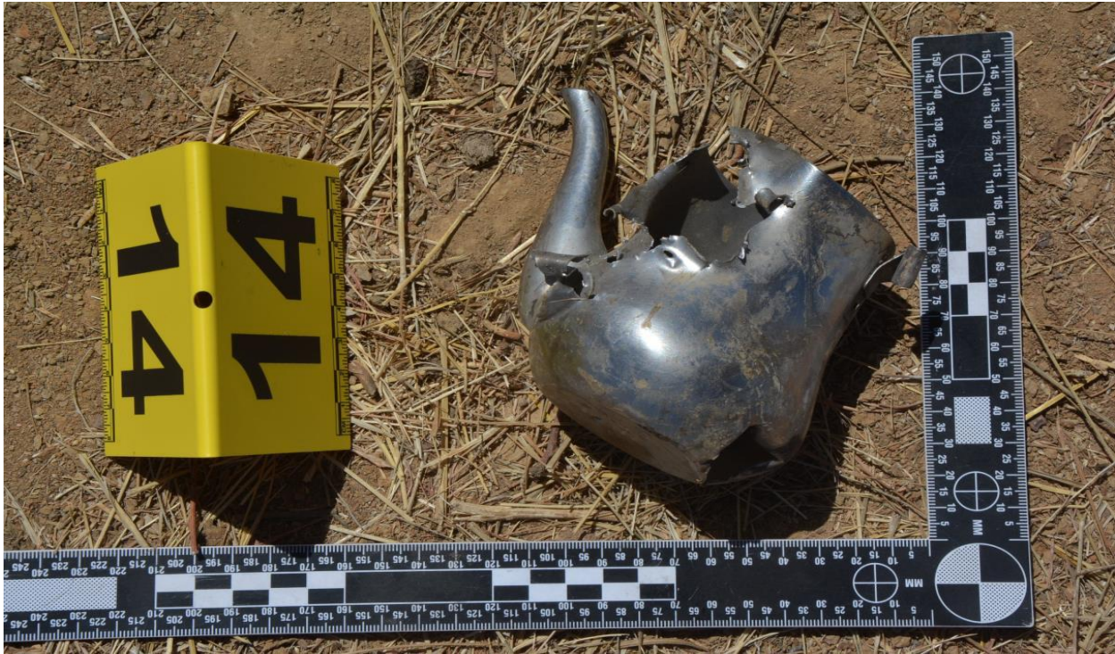
Photo 15 : Vue rapprochée des vestiges d'une petite théière, dont le métal est déchiqueté par endroits