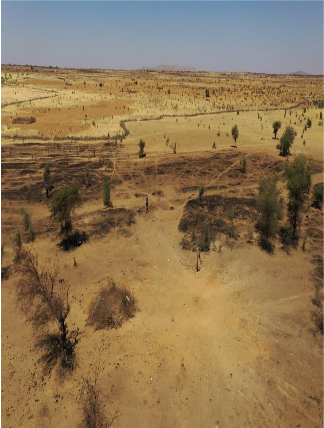
Photo 2 : Vue générale du lieu de l'incident – vue aérienne en direction du Nord