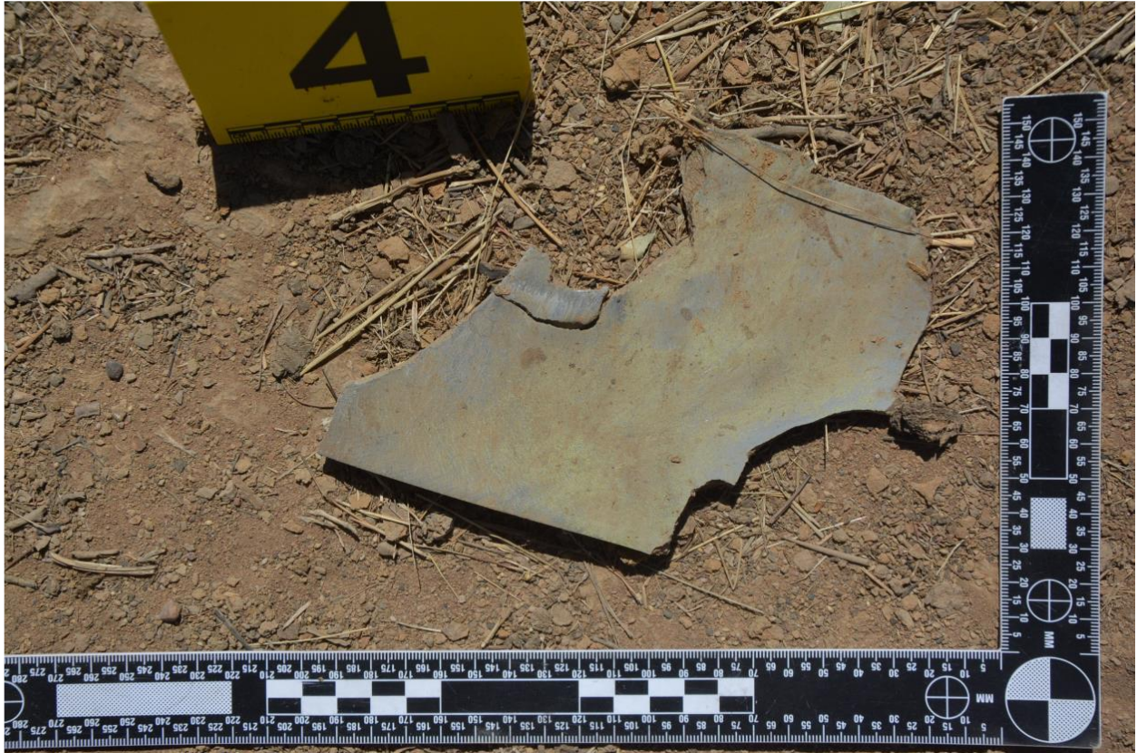
Photo 8 : Vue rapprochée d'un fragment métallique d'approximativement 19 cm x 13 cm