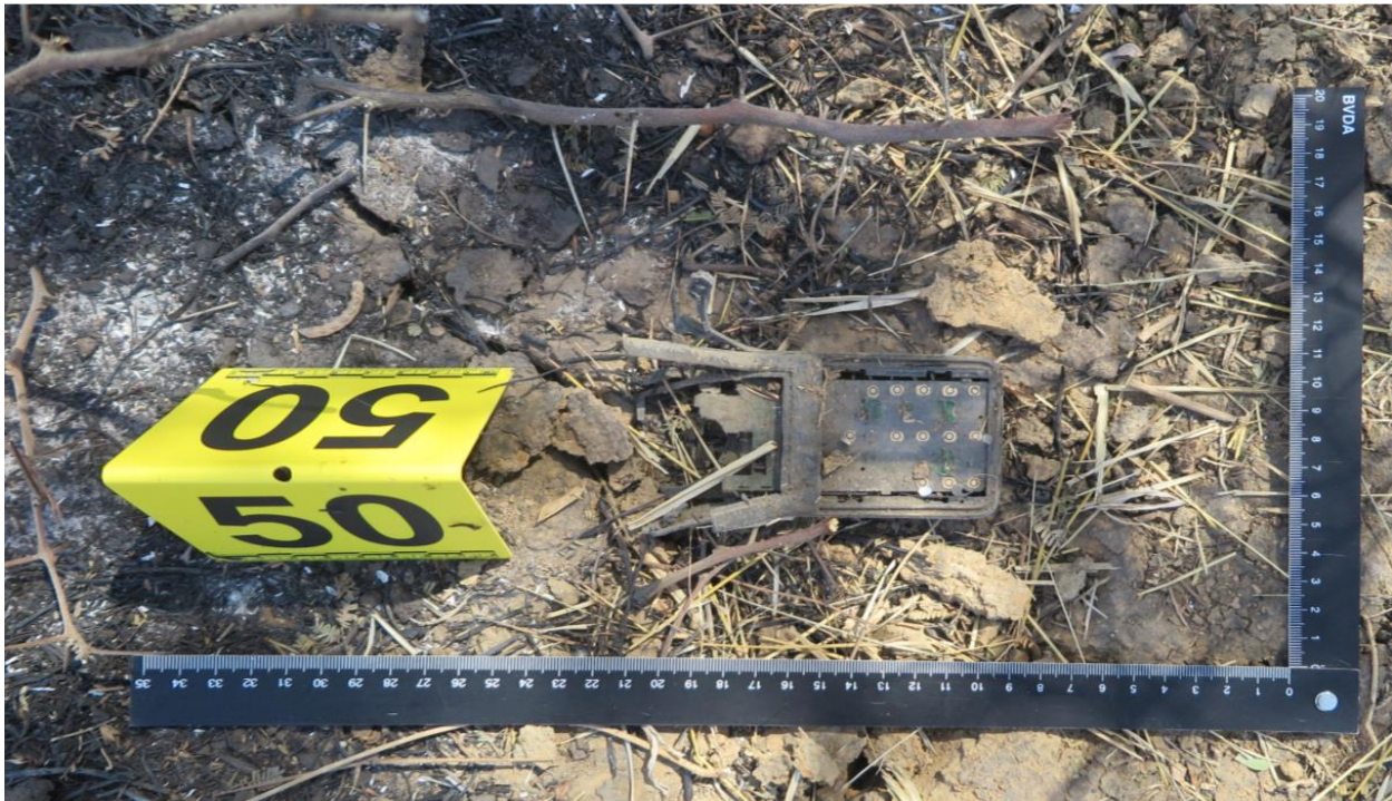
Photo 16 : Vue rapprochée des vestiges d'un téléphone portable de marque CITEL, double SIM (SIM absentes) dont les références et numéros IMEI apparaissent sur l'étiquette interne.