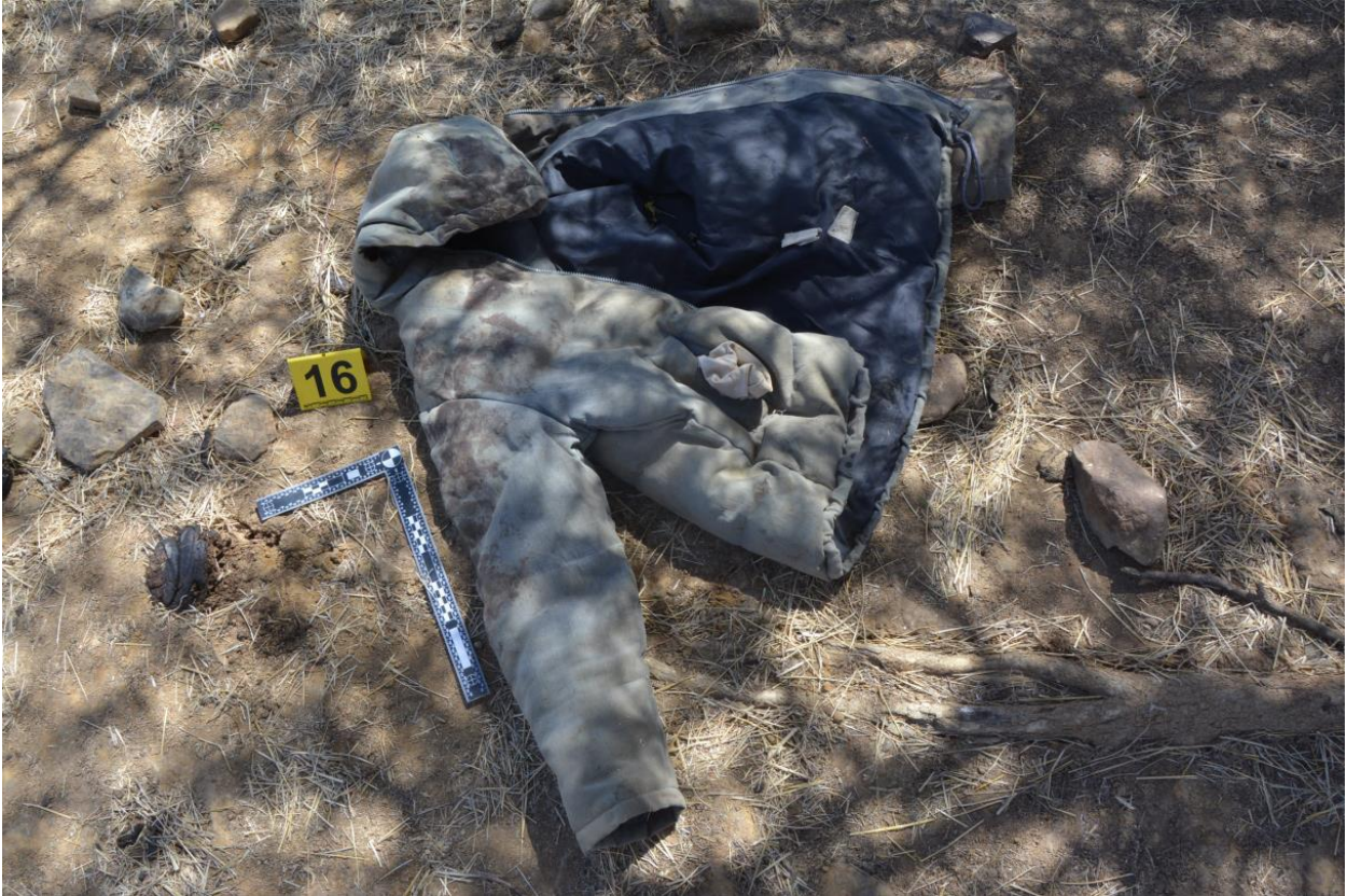
Photo 13 : Vue rapprochée d'une parka tachée décrochée d'un l'arbre